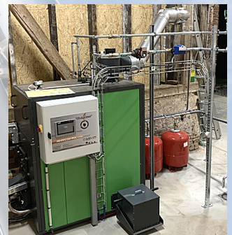
CHAUDIERE HEIZOMAT BIOMASSE