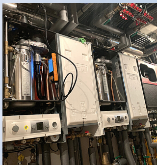
CASCADE GAZ WOLF 70 KW HOTEL