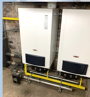
CHAUFFERIE WOLF COLLEGE