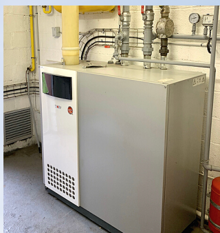
CHAUDIERE GAZ WOLF 210KW