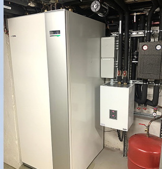
GEOthermie NIBE RESIDENCE ETUDIANTE