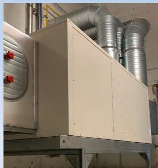
CTA GAZ 110 KW