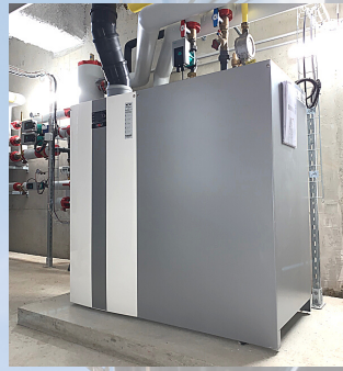
CHAUFFERIE GAZ IMMEUBLE 65 LOGTS