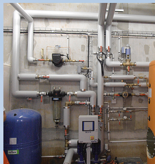
SURPRESSEUR KSB EAU FROIDE