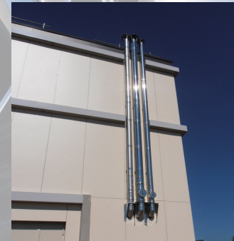
CONDUIT JEREMIAS CHAUFFERIE