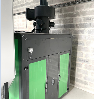
CHAUDIERE BOIS 350KW PRODUCTION AGRICOLE