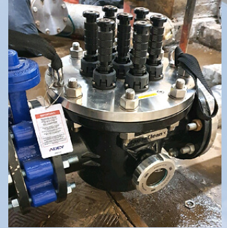
FILTRE MAGNETIQUE ADEY CIRCUIT CHAUFFAGE