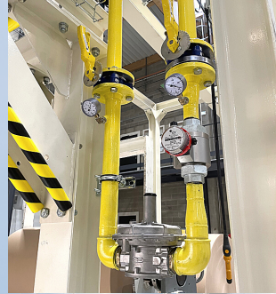
REGULATION GAZ FOUR INDUSTRIEL